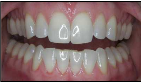
شکل ۱. اندازه‌گیری طول تاج کلینیکی دندان‌ها

سپس از روی عکس‌های حالت لبخند ارادی و استراحت، میزان نمایان شدگی دندان‌ها و لثه اندازه‌گیری شد. این اندازه‌گیری به منظور حذف اثرات ناشی از عدم تقارن‌های صورت، در هر دو سمت راست و چپ انجام شد. همچنین میزان بزرگ‌نمایی عکس‌ها با استفاده از خط‌کشی مدرج که بر روی پیشانی افراد قرار می‌گرفت، در اندازه‌گیری‌ها دخالت داده شد. از آنجایی که ارتفاع خط لب نسبت به مارژین لثه بیان می‌گردد بنابراین فاصله میان مارژین لثه هر یک از دندان‌های مذکور تا برادر داخلی لب در حالت لبخند زدن اندازه‌گیری شد.