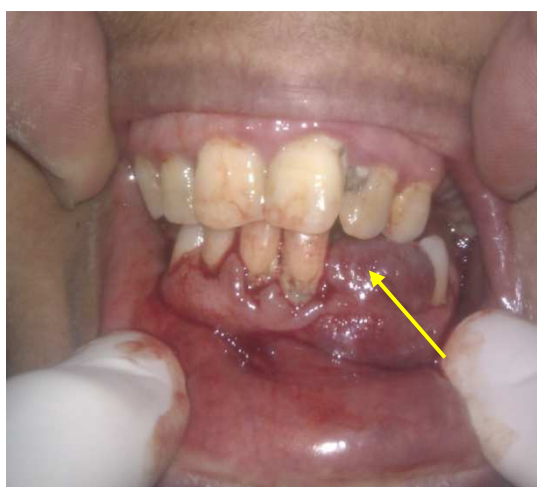
شکل ۱. نمای بالینی ضایعه ژانت سل گرانولومای مرکزی قبل از درمان

بهداشت دهانی بیمار بسیار ضعیف و وجود پلاک میکروبی در نواحی مارژین لثه‌ای کاملاً مشهود بود (شکل ۱). به دلیل خونریزی متعاقب تحریکات مزمن و بیرون‌زدگی بافت نابه‌جا از ساکت دندان، توجه بیمار جلب شده بود. دندان‌های اطراف ضایعه، به دلیل از دست رفتن اتکای استخوانی، لق بودند اما تست‌های حیاتی مؤید زنده بودن دندان‌های مذکور بود. سابقه پزشکی و آزمایشات سرولوژیک و ادرار بیمار نشان داد وی مبتلا به نارسایی مزمن کلیوی است که از چند سال قبل وجود داشته است.