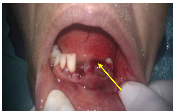
شکل ۳. نمای دهان بیمار پس از جرم‌گیری و خارج کردن دندان‌های درمان‌ناپذیر (پیکان به ضایعه اشاره می‌کند)

به دلیل جرم و پلاک میکروبی و تمایل به خونریزی ضایعه و به منظور پسرقت اندازه ضایعه، ابتدا فاز اول درمان که شامل جرم‌گیری و صاف نمودن سطح ریشه بود، برای بیمار انجام شد. بعد از آن دندان‌های درمان‌ناپذیر (Hopeless) که شامل دندان سانترال و پرمولر اول سمت چپ پایین بود خارج شد (شکل ۳ و ۴).