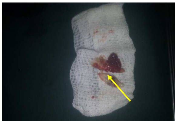
شکل ۴. دندان‌های خارج شده سانترال و پرمولر اول پایین

سپس ضایعه قسمت قدام فک پایین از طریق جراحی اگزیشنال با تیغه بیستوری ۱۵ خارج شده و در فرمالین ۱۰ درصد قرار داده شد و سپس به آزمایشگاه آسیب‌شناسی انتقال داده شد. شکل ۵، نمای بالینی ضایعه را پس از جراحی نشان می‌دهد. ضایعه در نمای ماکروسکوپی، به صورت یک قطعه بافت نرم هرمی شکل گرانولر به رنگ کرم قهوه‌ای با پوشش مخاطی به ابعاد 20 \times 15 \times 15 میلی‌متر قابل مشاهده بود.