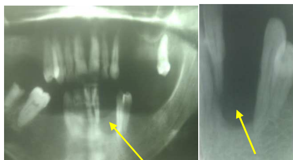
شکل ۲. نمای رادیوگرافی ضایعه قبل از درمان

در بررسی رادیوگرافی، یک رادیولوسنسی با حدود مشخص در قسمت قدامی سمت چپ فک پایین به همراه رادیولوسنسی‌های متعدد دیگر در نواحی خلفی مشهود بود (شکل ۲).