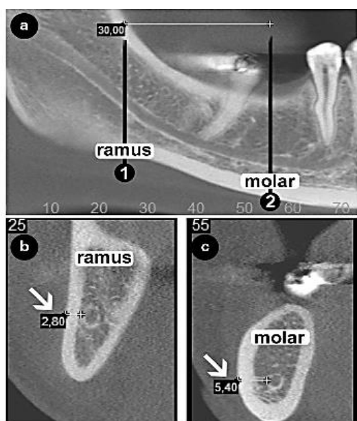
شکل ۱: نحوه‌ی اندازه‌گیری فاصله‌ی بین کانال مندیبولار و کورتکس باکال

۲۱ تا ۳۵ میلی‌آمپر ثانیه (بسته به جثه‌ی بیمار) با رزولوشن بالا، فوکال اسپات ۰/۵ میلی‌متری، اسکن‌تایم ۱۴ ثانیه و توتال فیلتر ۲/۵ mmAL تهیه شده بودند. فاصله‌ی منبع تا بیمار نیز به صورت تقریبی ۲۲۰ میلی‌متر به دست آمد که این تصاویر CBCT در نرم‌افزار (Fabrikstr31, Bensheim, Germany) SIDEXIS 3D مورد بررسی قرار گرفت. این نرم‌افزار ابزار مورد نیاز برای اندازه‌گیری فاصله‌ها را فراهم می‌آورد. تصاویر در مقاطع آگزیاال، کراس‌سکشنال، پانورامیک بازسازی شده و تانجنشیال بررسی شدند (شکل ۱).