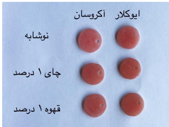
شکل ۴: مقایسه‌ی تغییر رنگ حاصل از مواجهه با محلول نوشیدنی‌های رنگ‌زا بین نمونه‌های آکروسان و ایوکلاک

به منظور مرتبط ساختن اختلاف رنگ محاسبه شده ( \Delta E ) با آنچه که در کلینیک مورد توجه است، داده‌ها بر حسب شاخص (National Bureau of standard units) NBS units نیز ارائه شدند (جدول ۱) (۱۸).