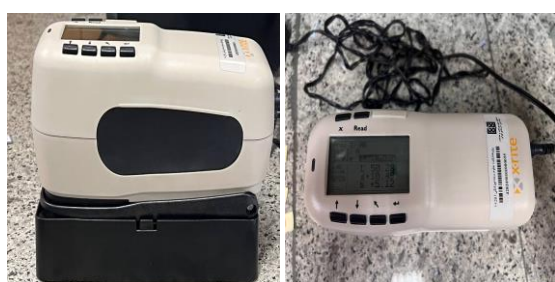
شکل ۳: تصاویری از دستگاه اسپکتروفوتومتر انعکاسی جامدات X-rite sp62

سیستم استاندارد CIE Lab می‌باشد. این سیستم، رنگ‌ها را تحت عنوان ۳ پارامتر L^* ، a^* و b^* توصیف می‌کند. L بیانگر میزان روشنایی بوده که ۰ آن نشان‌دهنده‌ی سیاه و ۱۰۰ مربوط به سفید می‌باشد. همچنین پارامتر a نشان‌دهنده‌ی میزان قرمزی-سبزی و پارامتر b بیانگر میزان زرد-آبی بودن رنگ مورد ارزیابی است (۱۷). در ابتدای جلسه دستگاه طبق دستور کارخانه کالیبره شد. سپس هر نمونه ۳ بار مورد ارزیابی قرار گرفت و اعداد مربوطه ثبت شد.