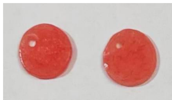
شکل ۲: تصویری از نمونه‌های تهیه شده

وسیله‌ی حمام آب ۱۰۰ سانتی‌گراد و به مدت ۲۰ دقیقه صورت گرفت. پس از اتمام پلیمریزاسیون، اجازه داده شد که مفل‌ها به دمای اتاق برسند و بعد از آن نمونه‌ها خارج شده و اضافات گچ روی آن‌ها پاک شدند. برای پرداخت نمونه‌ها و حذف اضافات رزینی از فرز کارباید (Teeskavan, Hashtgerd, Iran) بهره گرفته شد. بعد از آن قطر و ضخامت همگی نمونه‌ها توسط گیج ارزیابی شد تا نمونه‌های یکسانی به قطر ۱۵ و ضخامت ۲ میلی‌متر داشته باشیم. در کنار همه‌ی نمونه‌ها توسط فرز کارباید کوچک یک سوراخ ریز جهت استفاده در مرحله برچسب‌گذاری ایجاد گردید (شکل ۲). به منظور پالیش نمونه‌ها، کاغذهای سیلیکون کارباید (EVE Ernst Vetter, Keltern, Germany) مرطوب مورد استفاده قرار گرفت و یک سطح از همه‌ی آن‌ها پالیش شد. در نهایت دیسک‌های تهیه شده توسط آب لوله‌کشی شستشو داده شده و به مدت ۲۴ ساعت در آب و دمای اتاق نگهداری شدند. به منظور کاهش خطا همه نمونه‌ها توسط یک شخص تهیه شدند.