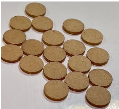
شکل ۱: تصویر دای‌های شیشه‌ای

تمام سطوح دای‌ها جهت ایجا فضا برای پالیش و پرداخت و جداسازی آسان از گچ، با موم رز به ضخامت ۱/۵ میلی‌متر پوشانده شد. مراحل مفل‌گذاری با گچ دندان‌پزشکی در لابراتوار انجام شده و پس از آن دای‌های شیشه‌ای خارج شدند. حذف موم نیز توسط آب جوش صورت گرفت. پودر و مونومر هر یک از برندها مطابق دستور کارخانه مخلوط شده و به صورت کانونشال در فضای ایجاد شده پس از خارج‌سازی دای‌های شیشه‌ای، پک شدند. پس از پرس ۲ مرحله‌ای، پلیمریزاسیون به