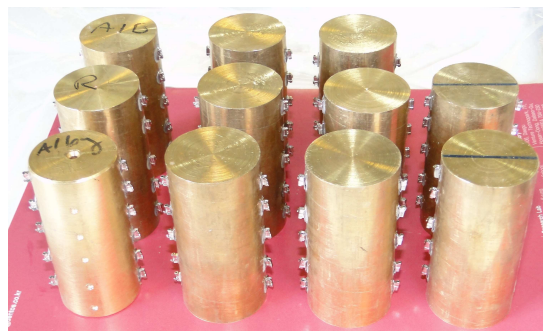
شکل ۱. نمونه‌های باکال تیوب فلزی باند شده به سطح آمالگام آماده سازی شده با کمک سه رزین حد واسط

در شکل ۱، نمونه‌های باکال تیوب فلزی باند شده به سطح آمالگام آماده سازی شده با کمک سه رزین حدواسط AP، AB2 و RMP به نمایش گذاشته شده است.