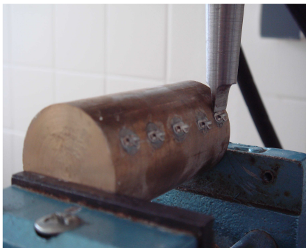
شکل ۲. نمونه‌های اتچمنت آماده شده تحت آزمون استحکام باند برشی

توسط دستگاه دارتک قبل از جدا شدن باکال تیوب از سطح آمالگام یا مینا گزارش شد به این اندازه محاسبه شد (شکل ۲).