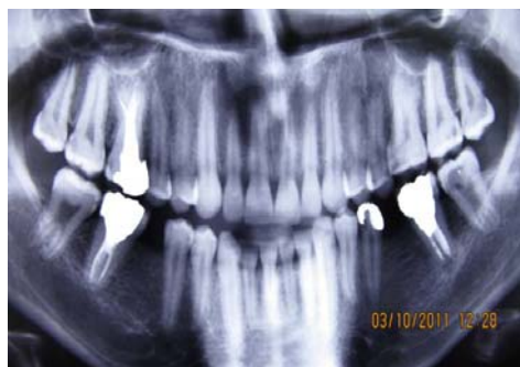
شکل ۳. رادیوگرافی پانورامیک بیمار بعد از اتمام درمان

دندان‌های دچار تارودنتیسم اختلاف‌های فراوانی از نظر اندازه اتاقتک پالپ، انسداد کانال‌ها و محل اپیکالی مدخل کانال‌ها دارند در نتیجه درمان ریشه آن‌ها مشکل‌ساز است [۳۳، ۳۴]. تصور می‌شود که تارودنتیسم از عدم فرورفتگی غلاف