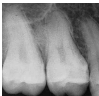
شکل ۲. رادیوگرافی اولیه دندان

بررسی رادیوگرافی یافته‌های زیر را نشان داد: