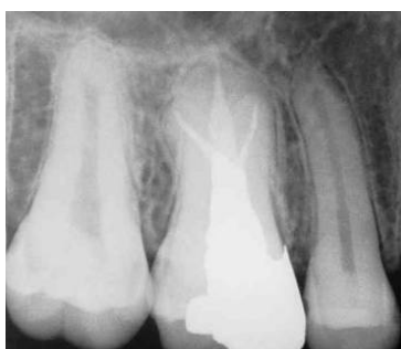
شکل ۵. رادیوگرافی دندان پس از ترمیم

جهت ترمیم تاج دندان از نقاط گیر موجود در اتاقتک پالپ استفاده شد و از قرار دادن پست داخل کانالها خودداری گردید. اتاقتک وسیع پالپ می‌توانست گیر مناسبی برای ترمیم ایجاد کند (شکل ۵). پس از ۶ ماه، بیمار فالوآپ شد، در گرافی بیمار هیچ تغییری در لامینادورا یا گشادشدگی لیگامان پرپودنتال مشاهده نشد و از نظر بالینی نیز بیمار به تست دق پاسخ نرمال داد و فاقد هرگونه پاکت بود، بافت‌های نرم اطراف دندان نیز کاملاً سالم بود.