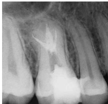
شکل ۴. رادیوگرافی دندان پس از اتمام درمان ریشه

پرکردگی ریشه متراکم را در سه کانال با طول از قبل تعیین شده تأیید کرد (شکل ۴).