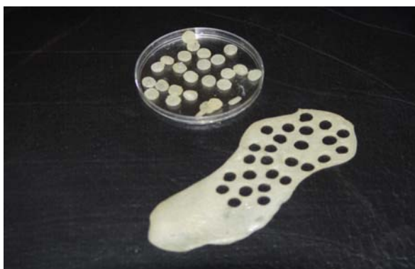
شکل ۱. دیسک‌های تهیه شده از مواد بهسازی بافت

آلیکنس 1 \times 10^5 CFU/ml قرار گرفت و به مدت ۴۸ ساعت در دمای ۳۰ درجه بر روی شیکر روتاتور (۱۰۰ rpm) انکوباسیون انجام شد. در پایان آزمایش دیسک‌ها را سه بار و هر بار به مدت ۵ دقیقه با محلول سرم فیزیولوژی استریل بر روی شیکر (۱۰۰ rpm) شستشو داده و در نهایت هر دیسک با ۱ میلی‌لیتر سرم فیزیولوژی استریل به مدت ۵ دقیقه در دستگاه شیکر به شدت تکان داده (۳۰۰ rpm) تا سلول‌های کاندیدا چسبیده به دیسک‌ها آزاد شوند. در پایان ۲۰ میکرولیتر از محلول شستشو داده شده دیسک‌ها را بر روی محیط کشت سابوردکستروز آگار به صورت یکنواخت کشت داده و پس از نگهداری پلیت‌ها به مدت ۴۸ ساعت در حرارت 30^{\circ}\text{C} ، تعداد کلنی‌های جدا شده شمارش شدند (شکل ۲).