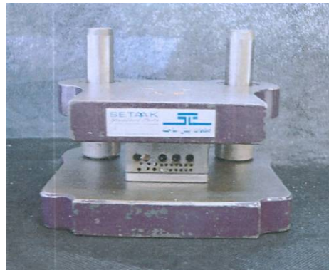
شکل ۱. وسیله آزمایشگاهی جهت قالب‌گیری

مدل آزمایشگاهی شامل دو بخش بالایی و پایینی بود که بخش پایینی، دارای صفحه پایینی، دای‌ها و دو میله راهنما در دو سو و بخش بالایی نیز، دارای صفحه بالایی و مسیرهایی برای حرکت میله‌های راهنما و تری اختصاصی بود. فاصله تری اختصاصی از لبه الگو، ۱۸ mm و از سر دای‌ها، ۸ mm بود (شکل ۱).