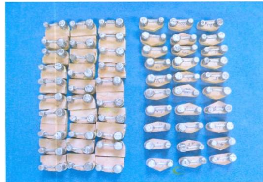
شکل ۳. مدل‌های گچی همراه با فریم‌های مربوطه

تکرار گردید و میانگین آن‌ها محاسبه گردید (شکل ۴). نتایج به دست آمده با روش آماری آنالیز واریانس یک سوپه و Tukey مورد بررسی قرار گرفت.