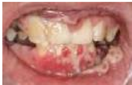
شکل ۱. اگزمای پوستی اطراف لب‌ها

اسکلتی مانند استئوپنی، اسکولیوزیس نیز در معاینه کلینیکی مشاهده نشد، از ابزارهای تشخیصی مانند تهیه رادیوگرافی از استخوان‌ها و دانسیتومتری در سابقه پزشکی بیمار استفاده نشده بود. همچنین بیمار سابقه عفونت ریوی و درگیری سیستم عصبی نداشت. در بررسی تاریخچه خانوادگی مشخص شد برادر ۵ ساله بیمار نیز از اگزمای پوستی و ضایعات دهانی با شدت کمتری رنج می‌برد اما به دلیل خفیف بودن علائم، والدین تمایل به درمان و بررسی بیشتر وضعیت فرزند دوم نداشتند (شکل ۳).