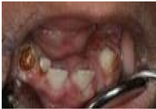
شکل ۳. زخم با غشای کاذب بر روی لثه