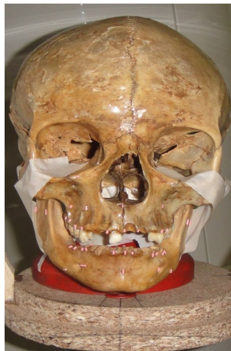
شکل 1. محل قرارگیری نشانگرها

سمت چپ و راست دو فک و راموس چپ و راست مندیبل. برای بررسی و اندازه‌گیری دو بعد یعنی عرض مزیدیستالی و ارتفاع، در هر ناحیه توسط گوتاپرکای میله‌ای شکل به طول 1/5 میلی‌متر و سایز 40 به عنوان مارکرهای اپک، سه نقطه مشخص شد، به این صورت که مارکر اول در باکال و در نقطه انتهایی کرست آلوئولار در ناحیه مورد بررسی (سانترال، پرمولر، یا مولر) چسبانده شد. مارکر دوم به اپیکالی‌ترین بخش زائده آلوئولار در محاذات مارکر اول و همچنین مارکر سوم در سمت باکال دندان مجاور مارکر اول متصل شد (شکل 1). به این ترتیب ارتفاع و عرض مزیدیستالی در ابعاد دندانی قابل اندازه‌گیری در مجسمه و نیز قابل اندازه‌گیری در تصویر به عنوان شاخص‌های اپک مشخص شد.